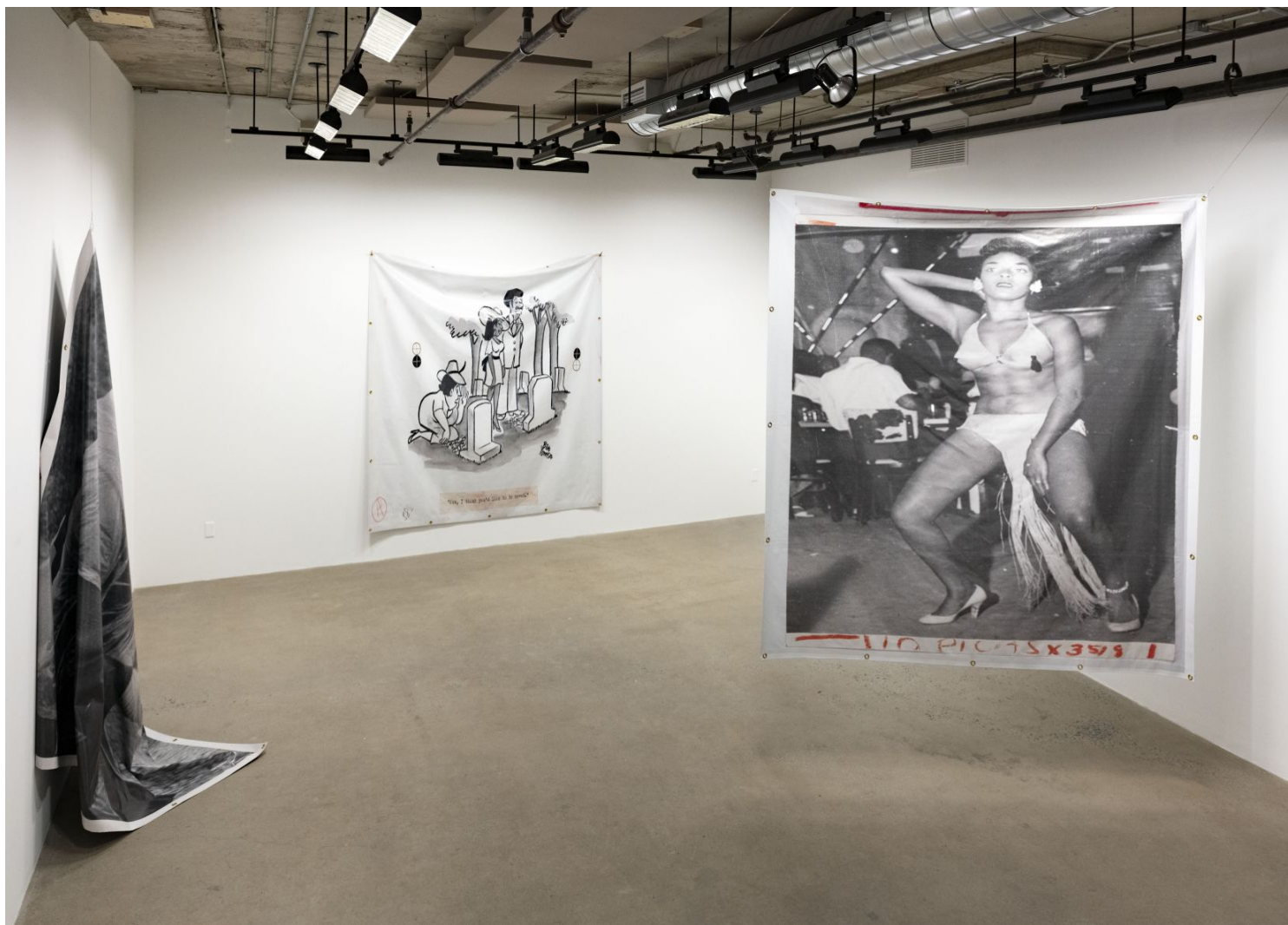
Vue de l'expo «The Banner Waves Calmly», de Theaster Gates. La bannière accrochée au mur s'intitule «Death Knows No Peace» et celle suspendue, «Dancehall Dance».